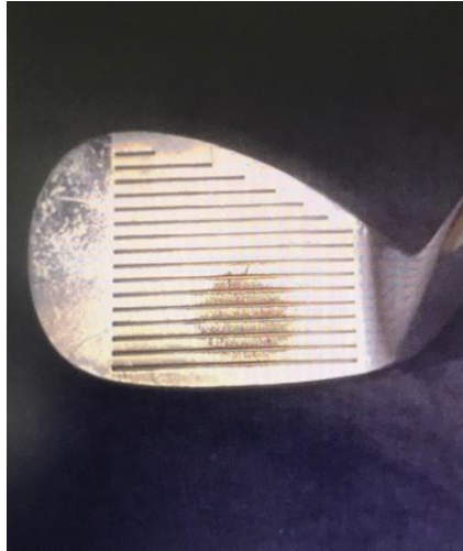
Tom Watsons SW