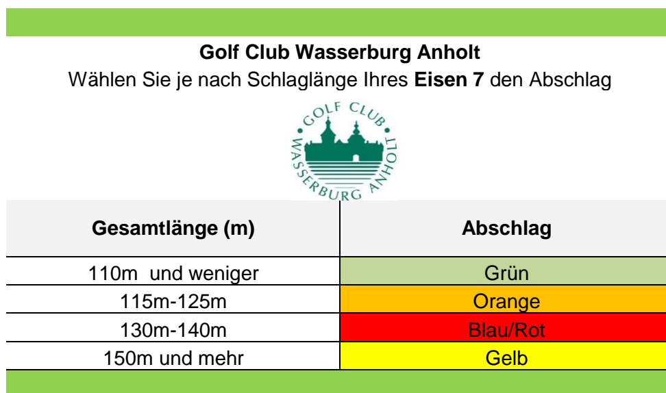
Abbildung 2: Wahl des Abschlags in Abhängigkeit von Schlaglänge

Entsprechend habe ich für uns im Golfclub Wasserburg folgende Orientierung für unsere Spieler und Gäste zusammengestellt: